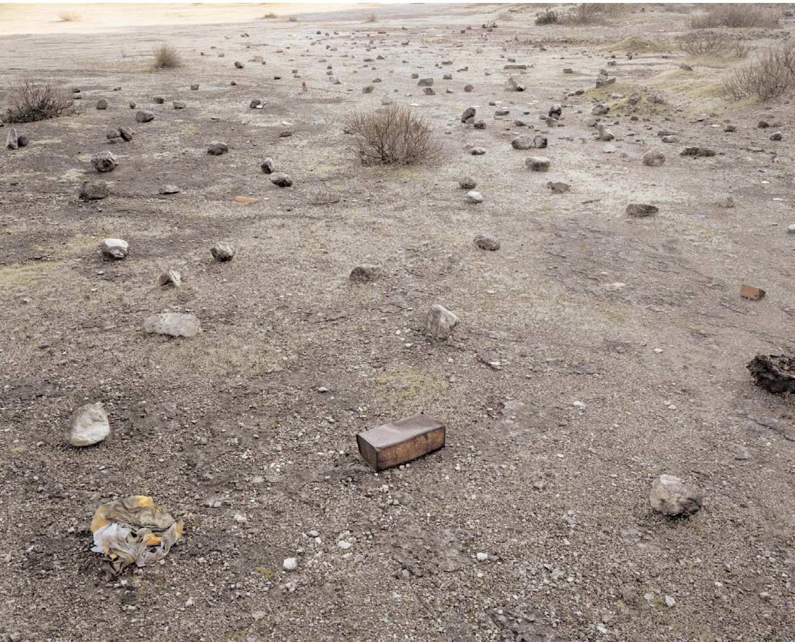
Thermopylae 480 BC, The Death of Leonidas, 2006