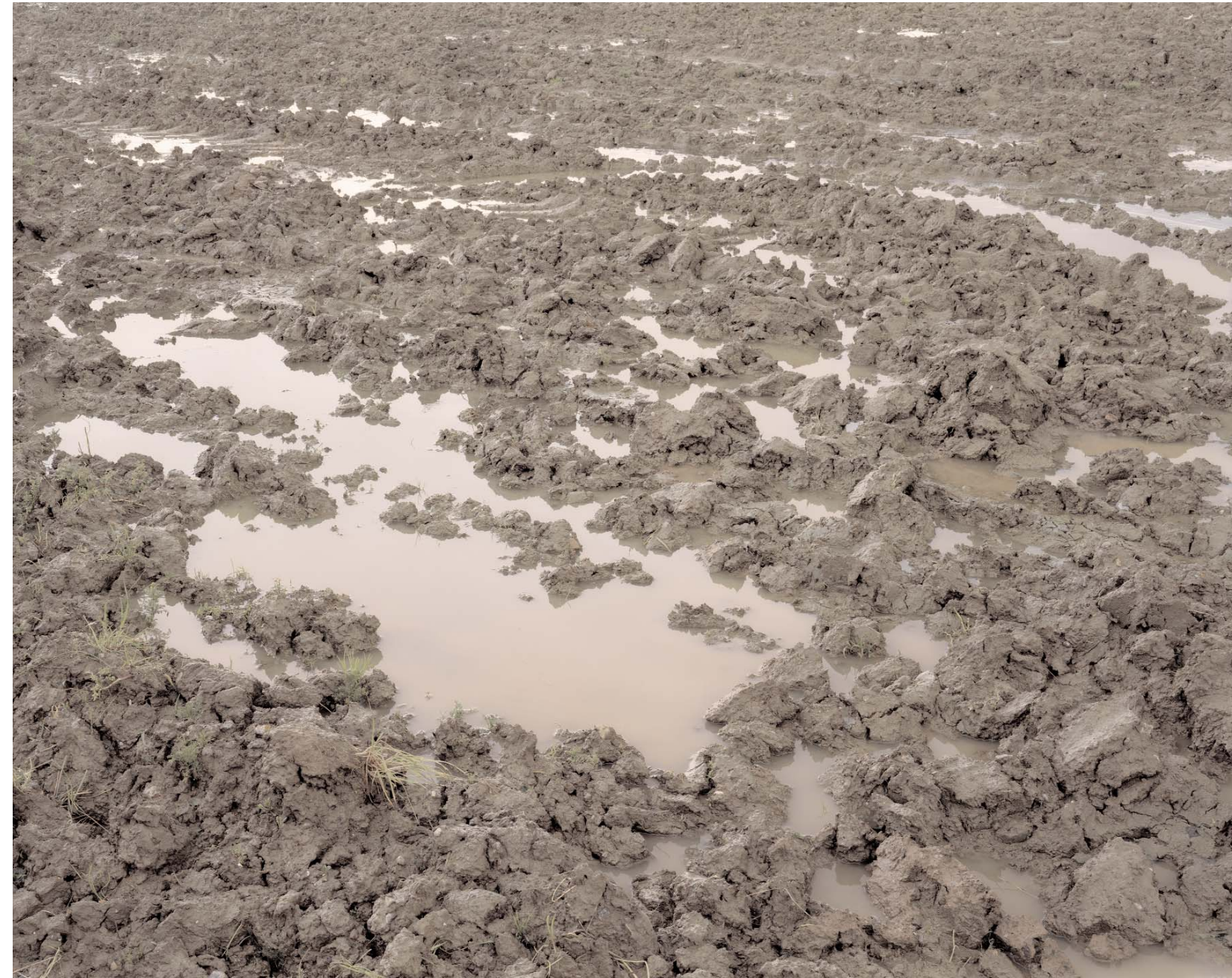
Passchendaele 1917, Tyne Cot, 2005

“One observer through what might have been a porthole of a ship... saw as still a sea as any sailor gazed on... watched the blessed sun dawning on still another sea of mud. And that too was beautiful! Sunrise, gold and orange fading into an ultra violet that the eye could not discern, and under it mud and swamp and brimming shell-holes, all reflecting the gaudy colours of the sky...”