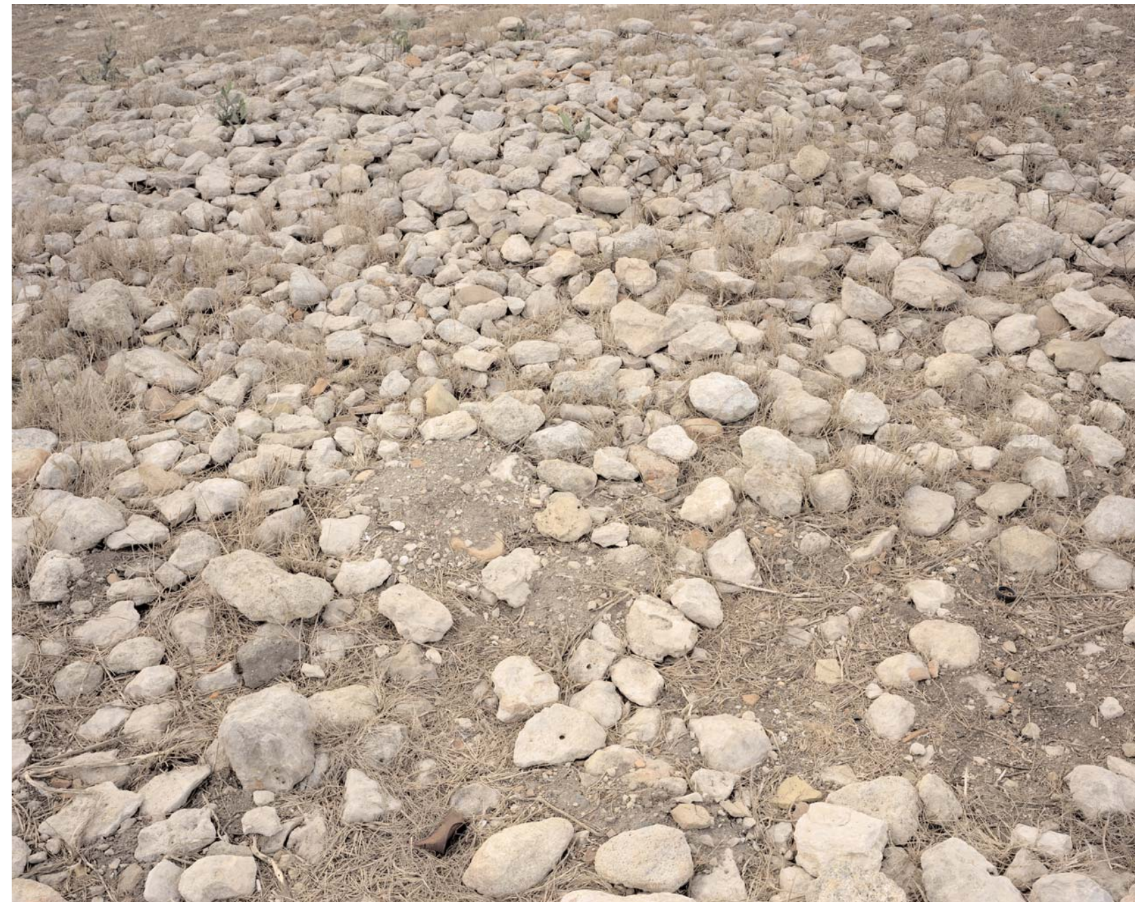
Cannae 216 BC, The Death of Paulus, 2004