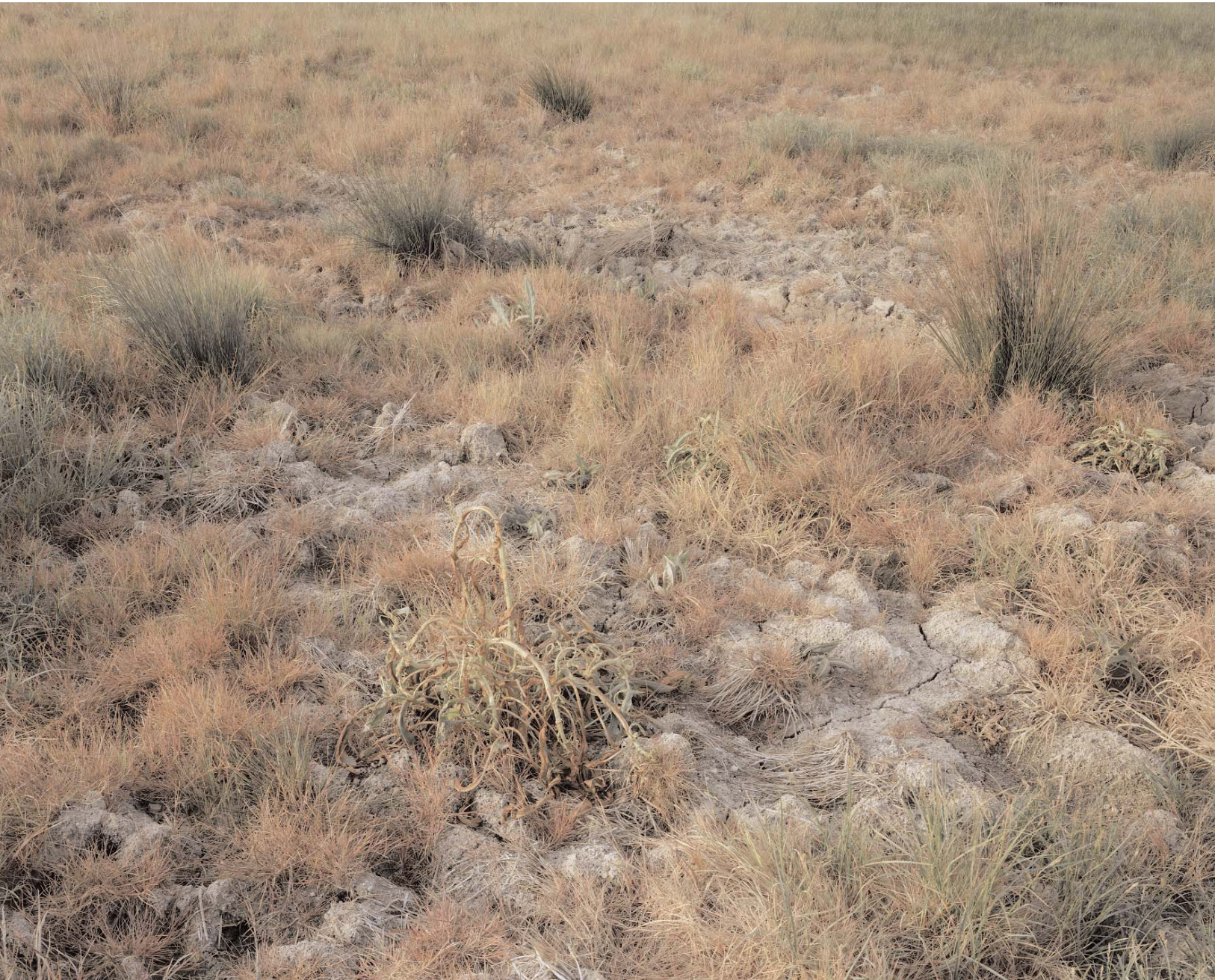
Poitiers 732, Abd ar-Rahman, 2002